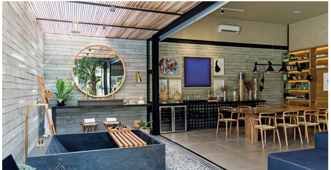
Genuss für alle Sinne: Das Outdoor-Badezimmer verlängert den Wohnraum ins Grüne. Enjoyment in every single sense: The outdoor bathroom extends the living area out into the greenery.

Die Designfliesen mit dem Charakter sägerauer Holzplanken sind prädestiniert für Privatsphären, die zugleich Geborgenheit und Wohlbefinden ausstrahlen. Dabei hält das zeitlos schöne Wandkleid wesentlich länger als ein Holz-Leben. Der Schlüssel liegt in der sorgfältigen Handanfertigung mit hochverdichtetem Architekturbeton, ein Werkstoff mit besonderen technischen Eigenschaften und Qualitäten bei Wind und Wetter. Gut für eine lange und wartungsfreie Nutzungsdauer ohne Kunststoff und Plastik-Image.